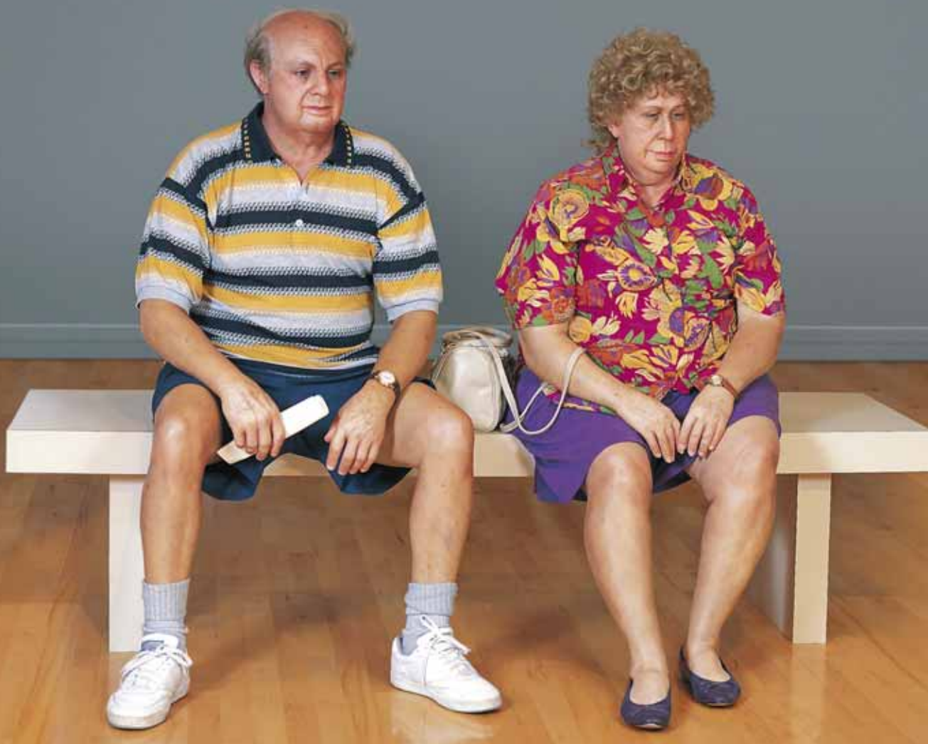
Duane Hanson, Vanha pariskunta penkillä (sarjasta, 1/2), 1994 • © VG Bild-Kunst, Bonn, 2006. Courtesy of the Institut für Kulturaustausch