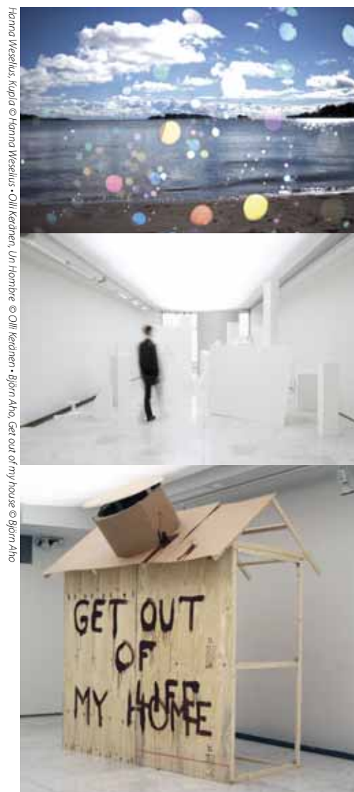
Hanna Weselius, Kupla © Hanna Weselius • Olli Keränen, Un Hombre © Olli Keränen • Björn Aho, Get out of my house © Björn Aho