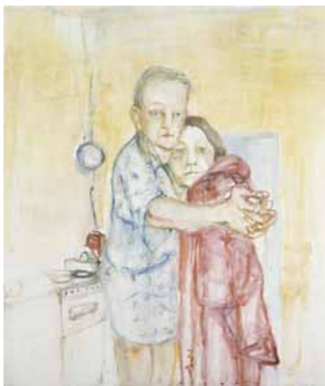
Jaakko Heikkinen, Tanssi II, 2003

H elsingin kaupungin taidemuseo esitteli valikoiman taidekokoelmansa uusimpia hankintoja. Jotta mahdollisimman monella olisi tilaisuus nähdä millaista nykytaidetta verorahoilla on ostettu, Taidemuseo Meilahteen oli näyttelyn aikana ilmainen sisäänpääsy.