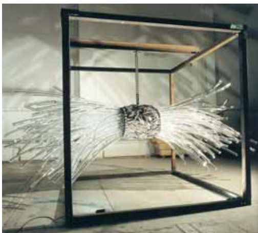
HC Berg, Eye of Light, 2000

Taiteilija Hans-Christian Berg (s. 1971) on koulutukseltaan sekä kuvanveistäjä että keramiikka- ja lasitaiteilija. Hän työskentelee laaja-alaisesti käyttäen materiaaleinaan mm. lasia, alumiinia, terästä ja muoveja. HC Bergin veistokset ja tilateokset leikkivät valolla ja optisilla illuusioilla.