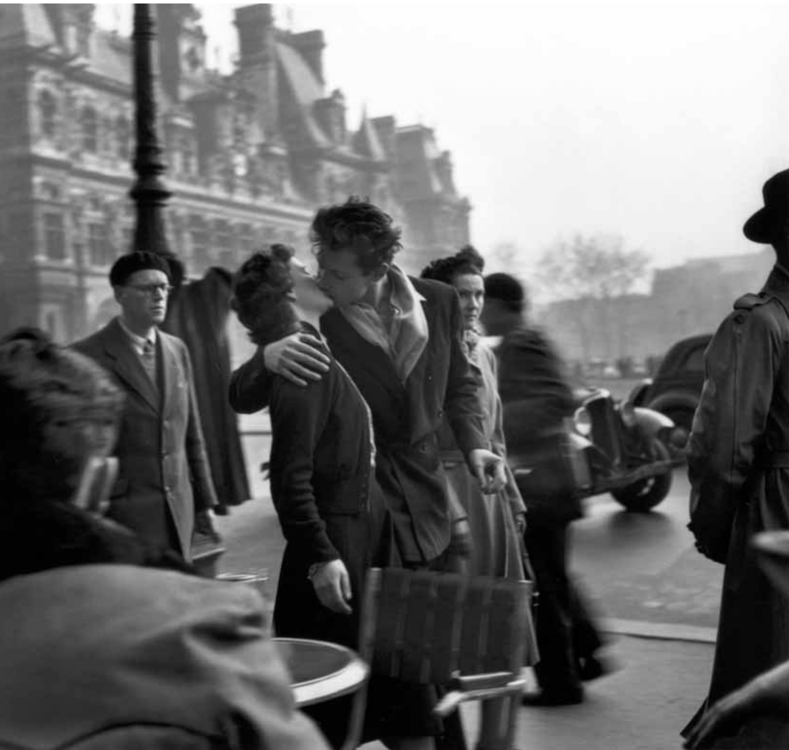
Robert Doisneau, Le baiser de l'Hôtel de Ville , 1950 • © Robert Doisneau / Rapho / di ChromA