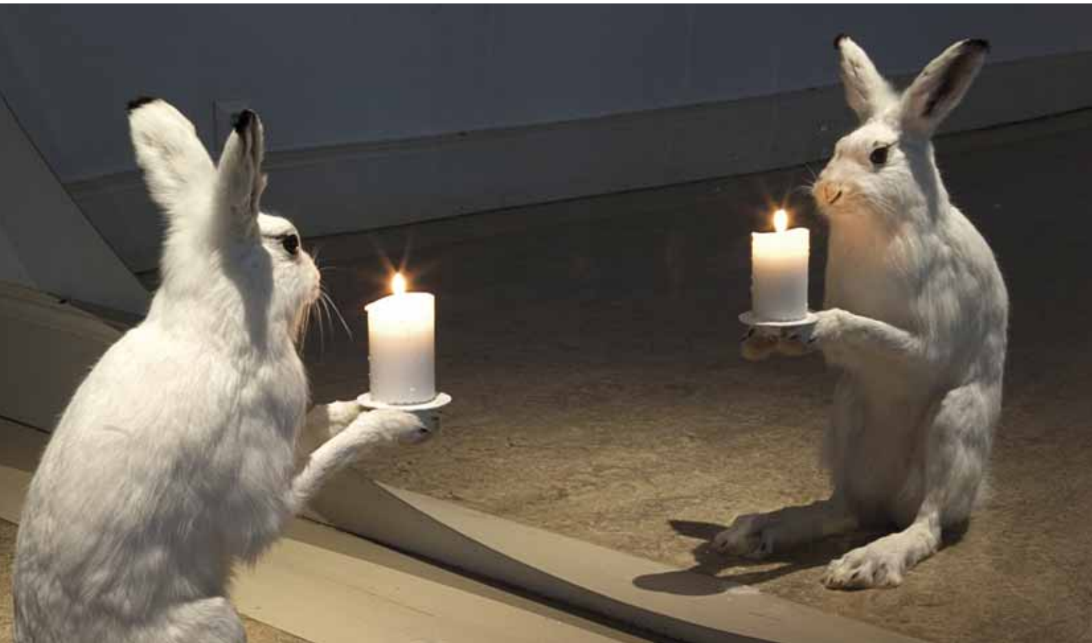
Pekka Jylhä, Albino , 2000