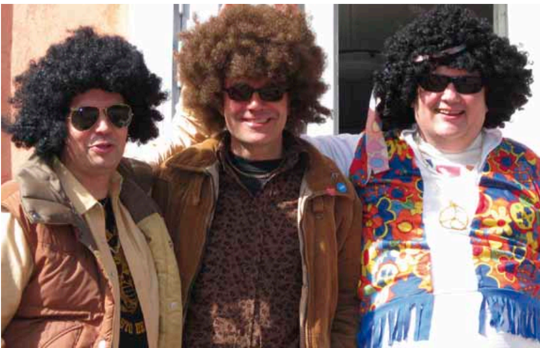
Henkilöstö juhli vapunjalkeisia 70-luvun teemalla.

Taidemuseo kuuluu tulospalkkiojärjestelmän piiriin. Tulostavoitteet toteutuivat 56,5 prosenttisesti ja henkilökunnalle maksettiin tulospalkkio. Henkilökuntaa palkittiin myös erinomaisista työtuloksista kannustus-palkkioilla. Henkilökunta osallistui TYHY-päivään, jota vietettiin 17.5. Porvoossa.