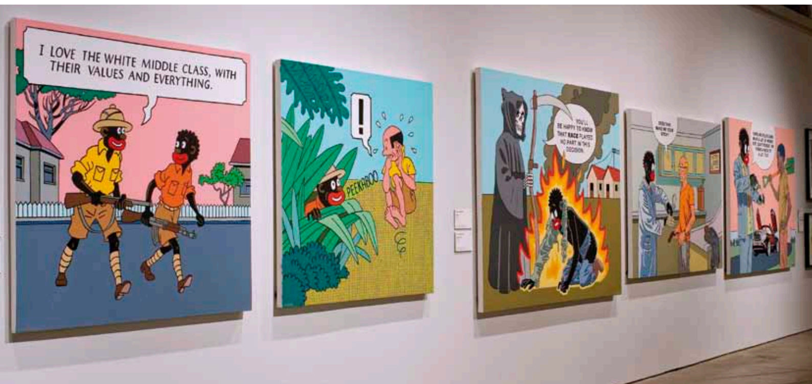
Kuvassa Anton Kannemeyerin teoksia Tennispalatsin Peekaboo-näyttelystä.