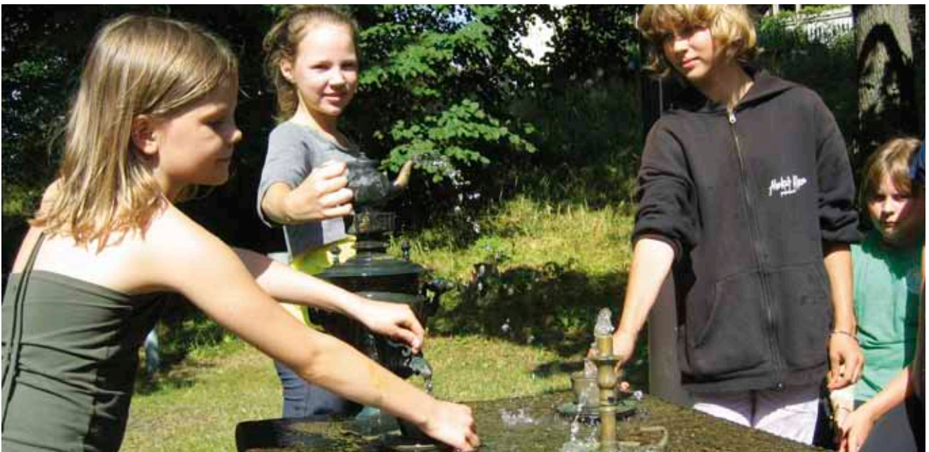
Kesäleirillä nuoret tutustuivat Kalle Hammin veistokseen Teetä kahdelle.