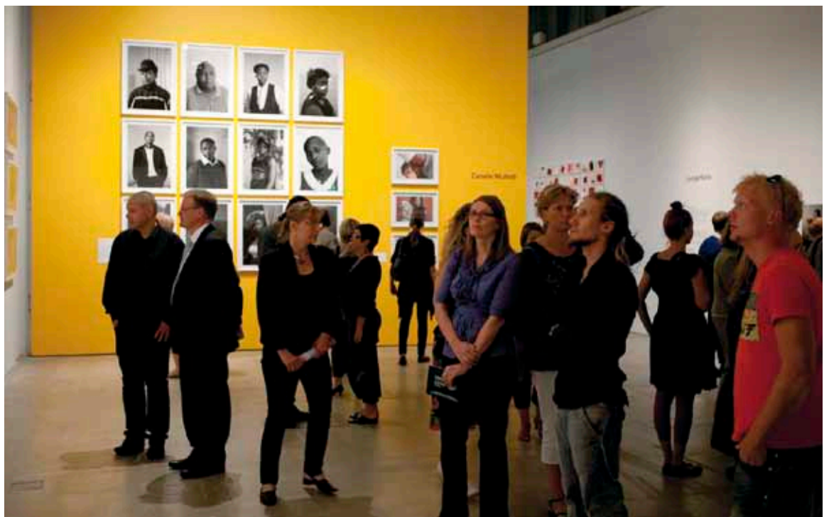
1. Claudette Schreudersin teos Julkinen hahmo Peekaboo-näyttelyssä. © Kuva: Hanna Kukorelli, 2. Georg Baselitz lehdistötilaisuudessa © Kuva: Maija Toivanen 3. Peekaboo näyttelyn avajaisvieraita. © Kuva: Hanna Kukorelli