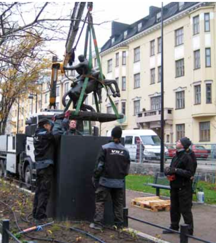
Emil Cedercreutzin Arcum tendit Apollo -veistos palautettiin takaisin Lastenlehdon puistoon.

Julkisen taiteen lahjoitushankkeissa taidemuseo toimii asiantuntijana, lausunnonantajana sekä teoksen vastaanottajana hankkeen toteutuessa. Deponoinnin osalta rooli on varsin samanlainen, mutta teoksen omistus ja ylläpitovastuu jää deponoijalle. Vuonna 2010 taidemuseo vastaanotti