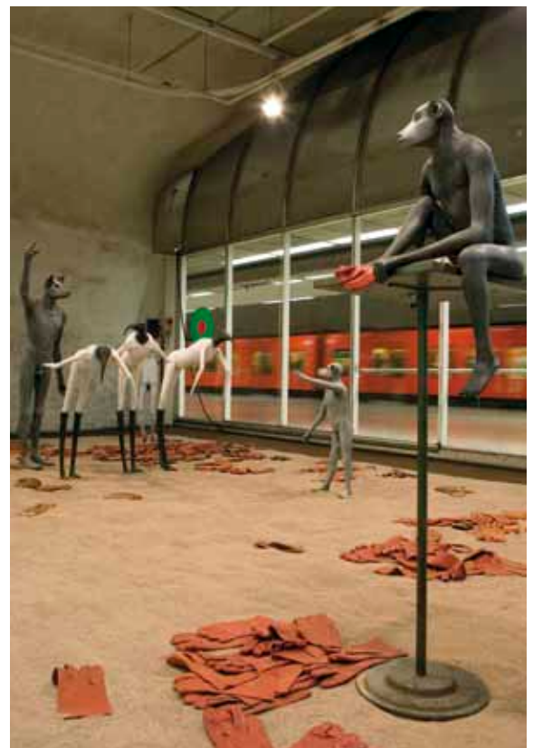
Kampin metroasemalla ohikulkijat saivat ihmetellä Jane Alexanderin outoja olioita.

Vuoden 2010 aikana tehtiin päätös lisätyövoiman palkkaamisesta Seuren kautta.