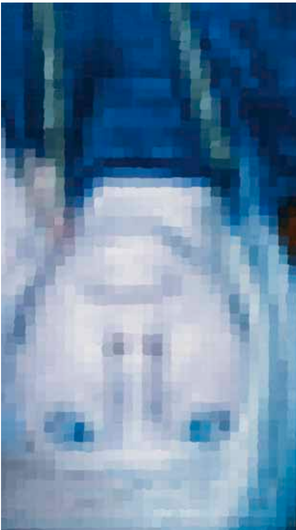
Sami Lukkarinen: Sonjas, 2010