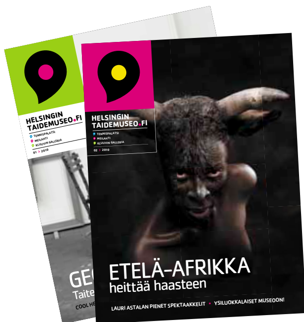
Helsingintaidemuseo.fi -lehteä oli saatavilla kirjastoissa, neljällä metro-asemalla sekä Tennispalatsissa.

Helsingin taidemuseo kehittää jatkuvasti saavutettavuuttaan. Museon tuleminen ja näyttelyihin tutustuminen pyritään tekemään erilaisille yleisöille mahdollisimman helpoksi ja antoisaksi. Näyttelyihin halutaan houkutella myös sellaisia yleisöryhmiä, jotka helposti jäävät taiteesta ja kulttuurista syrjään. Samalla huolehditaan, että museotilat ja -palvelut ovat myös fyysisesti mahdollisimman saavutettavia.