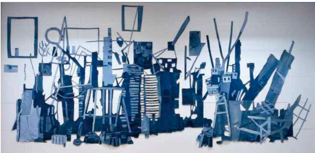
Miika Nyysösen teosta Jeans konservoitiin päiväkoti Merituulussa.

Konservointorit osallistuivat aluetaidemuseopäivän järjestelyihin sekä ICOM-CC Paintings Groupin Metropolissa järjestämään koulutuspäivään: "Current Practice and Recent Developments in the Structural Conservation of Paintings on Canvas Supports."