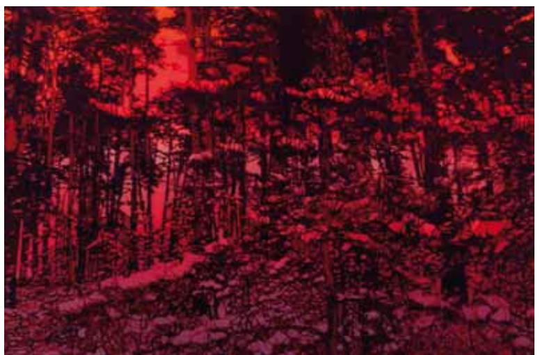
Tatu Tuominen: Väre, 2010