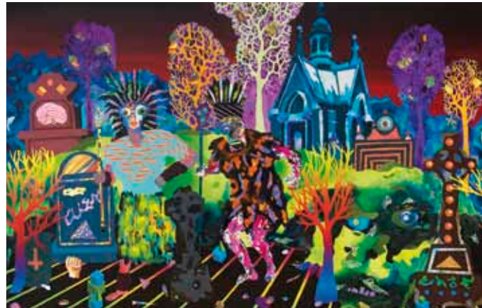
Timo Vaittinen: Evening at the Graveyard (2010) © Timo Vaittinen