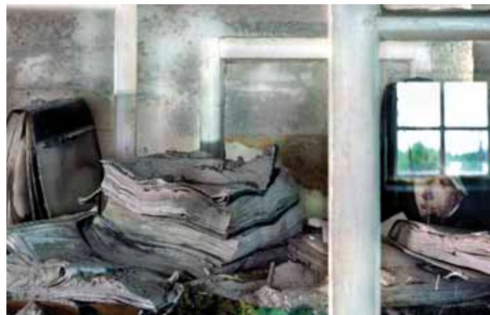
Hannu Pakarinen: Still Life with Art History Books (2008)