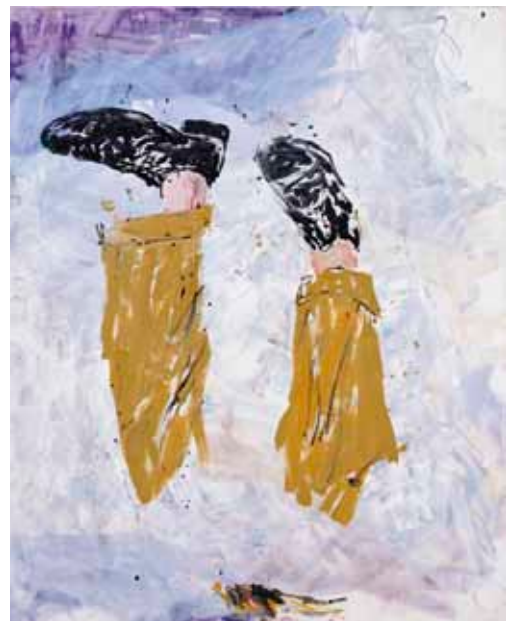
Georg Baselitz: Ratsastaja jalkaisin, 2005

Georg Baselitz käy intensiivistä vuoropuhelua myös taiteen historian kanssa. Häntä ovat aina kiinnostaneet ajan valtavirtojen ulkopuolella eläneet taiteilijat, joista monet olivat pohjoismaisia. Näyttelyssä ollut maalaus Kullervon jalat (1967) pohjautui Akseli Gallen-Kallela teokseen Kullervon kirous (1899). Viime vuosina Baselitzin maalaukset ovat vilisseet viittauksia erityisesti Edvard Munchiin