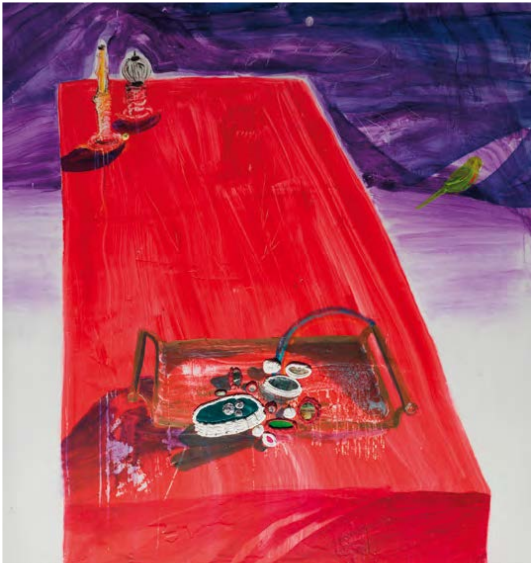
Jussi Gomanin: R.S.V.P. (maalauk), 2012.