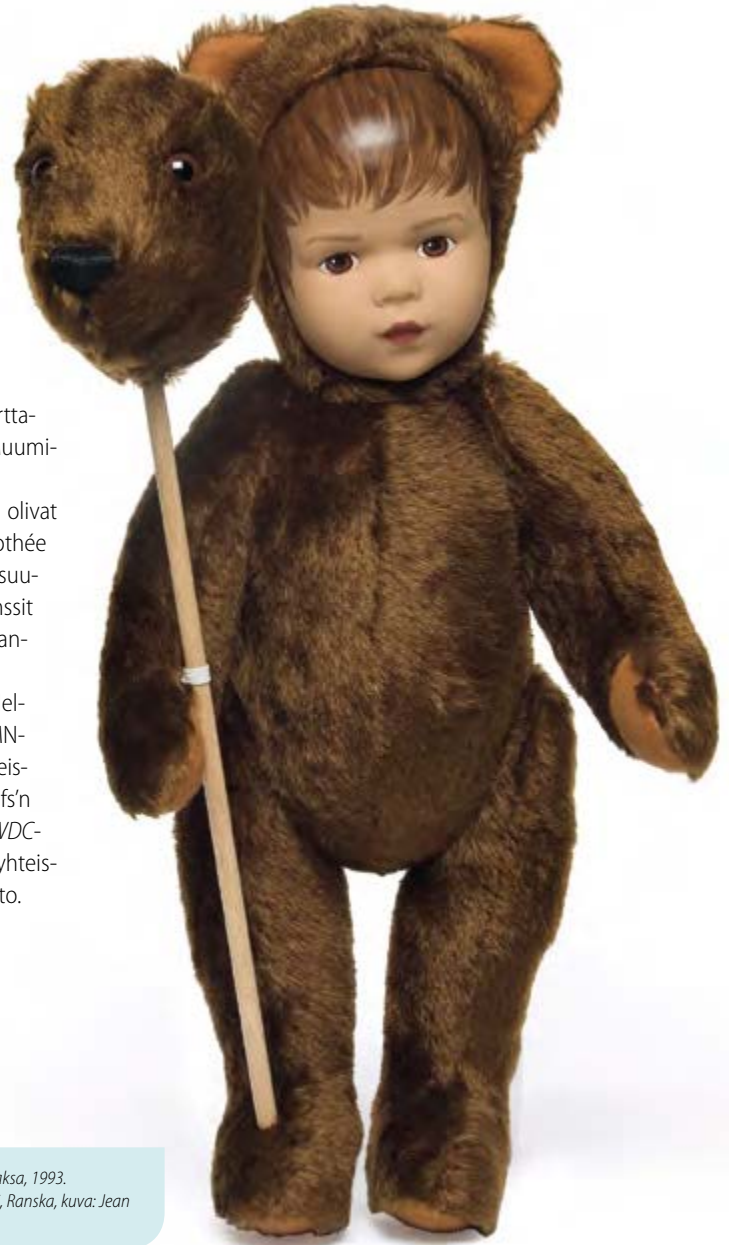
Nalle-nukke, valmistaja Sigikid, Saksa, 1993.

Näyttelyn tuottivat Helsingin taidemuseo ja RMN-Grand Palais Pariisissa yhteistyössä Les Arts Décoratifs'n kanssa. Näyttely oli osa WDC-ohjelmaa. Näyttelyn pääyhteistyökumppani oli HOK-Elanto.