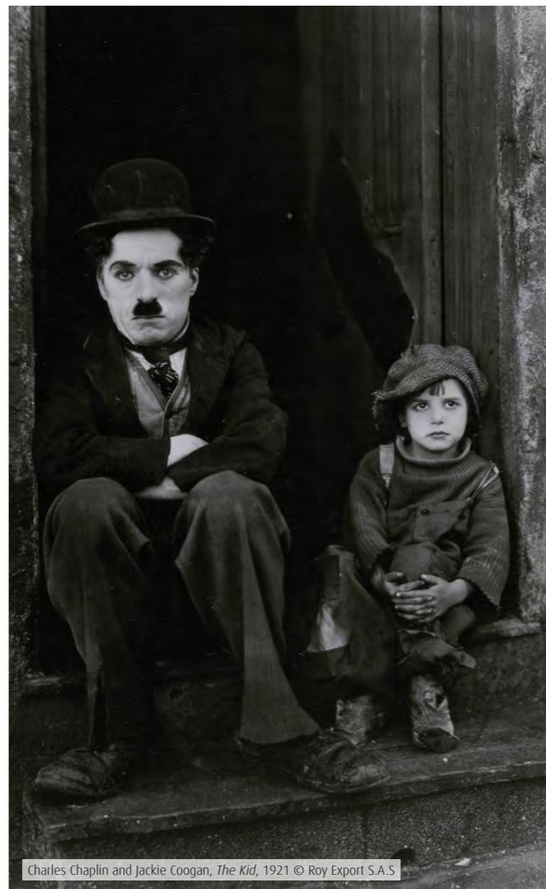
Charles Chaplin and Jackie Coogan, The Kid, 1921