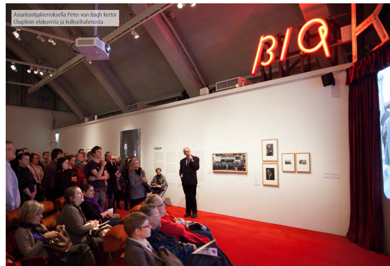
Asiantuntijakierroksella Peter von Bagh kertoi Chaplinin elokuvista ja kulkurihahmosta.

Nuoret, ikääntyvät ja maahanmuuttajat ovat taidemuseon yleisötyön erityisenä painopisteenä Helsingin kaupungin strategiaohjelman mukaisesti. Uusien yleisöjen saavuttamiseksi tehdään yhteistyötä erilaisten sidosryhmien kanssa, joista tärkeimpinä olivat vuonna 2014 helsinkiläiset opettajat, koulut, kulttuurikeskukset, Helsinki Missio ja nuorisosiainkeskus.