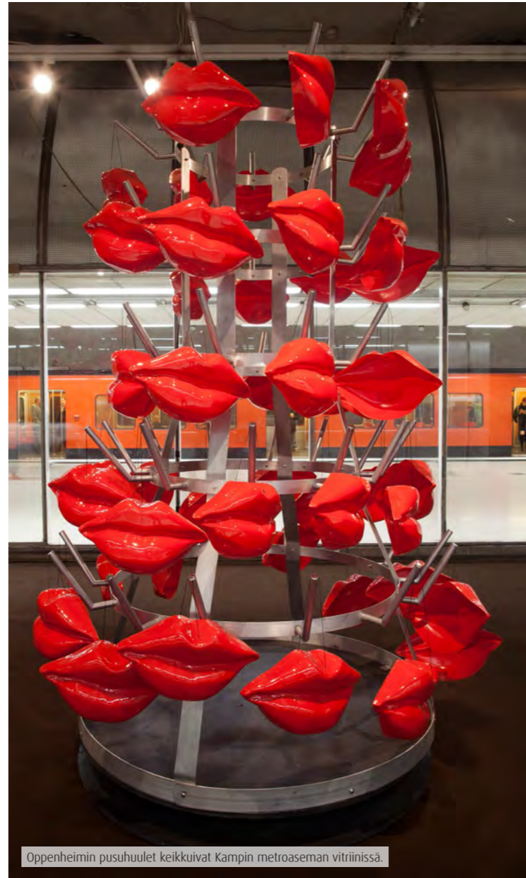
Oppenheimin pusuhuulet keikkuivat Kampin metroaseman vitriinissä.

Punaiset pusuhuulet piristivät ohikulkijoita koko syksyn. Dennis Oppenheimin teos Kissing Racks muodostui kahdesta pyörivällä alustalla olevasta pullonkuivaustelineestä, joihin oli kiinnitetty muovisia huulia. Veistos toi mieleen 1900-luvun alun ready-made -taiteen, jossa valmisesineet nostettiin taideteoksen asemaan. Kissing Racks viittaakin avantgarden ja ready-made taiteen keskeisen taiteilijan Marcel Duchampin (1887–1968) kuuluisaan teokseen Pullonkuivausteline (1914). Taiteilija lahjoitti teoksen taidemuseolle 1996.