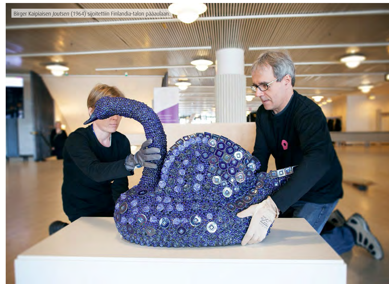
Birger Kaipiaisen Joutsen (1964) sijoitettiin Finlandia-talon pääaulaan.

Jotta taidemuseon kokoelmien teokset saadaan suuren yleisön saavutettavaksi, on tärkeää saada mahdollisimman paljon teoksia kuvatuksi ja digitoiduksi. Digitointia jatkettiin niin, että vuoden 2014 loppuun mennessä oli kokoelmasta digitoitu 55 %. Kuva-arkistosta tehtiin kuvalainoja 38 kpl, jotka sisälsivät kaikkiaan 148 kuvaa.