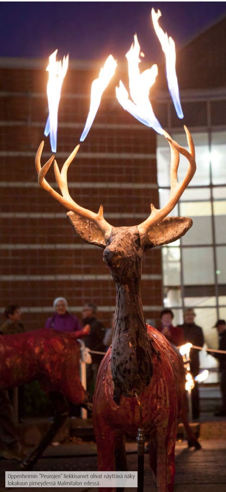
Oppenheimin "Peurojen" liekkisarvet olivat näytävä näky lokakuun pimeydessä Malmitalon edessä.

Helsingin ja asuinympäristön haltuunoton edistämiseksi taidemuseo järjesti maahanmuuttajalaisille tutustumiskierroksen Helsingin keskustan veistoksiin. Yhteistyössä kulttuurikeskus Caisan kanssa järjestetyllä kierroksella veistokset esiteltiin ja niistä keskusteltiin eri kulttuurien näkökulmista.