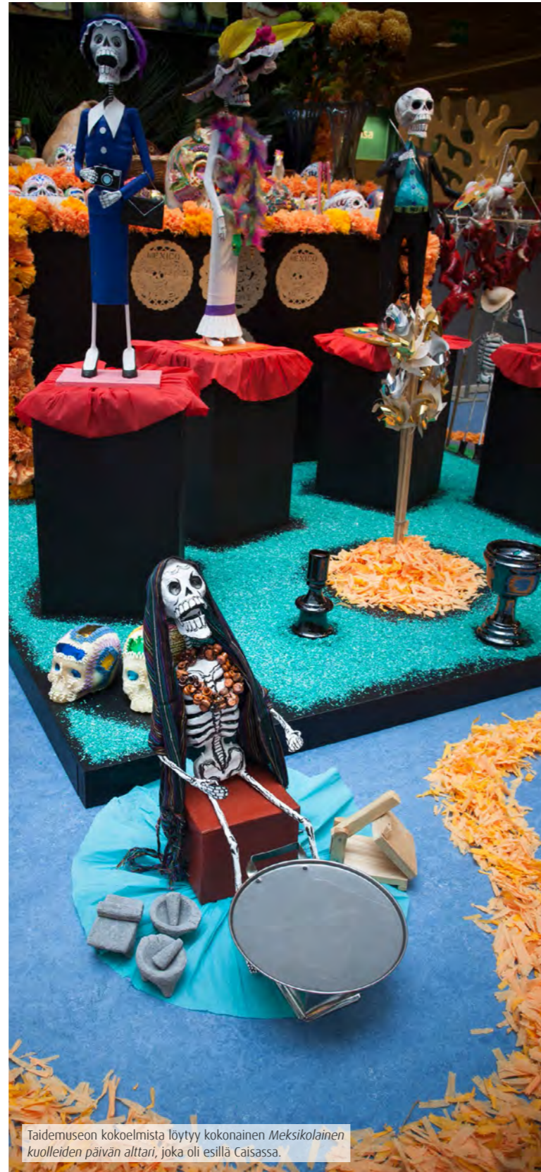
Taidemuseon kokoelmista löytyy kokonainen Meksikolainen kuolleiden päivän alttari, joka oli esillä Caisassa.

Alttari-installaatio on omistettu italialaiselle valokuvaajalle Tina Modottille sekä meksikolaisille taiteilijoille Frida Kahlolle ja Diego Riveralle. Ensimmäisen kerran installaatio pystytettiin Tennispalatsiin vuonna 2000.