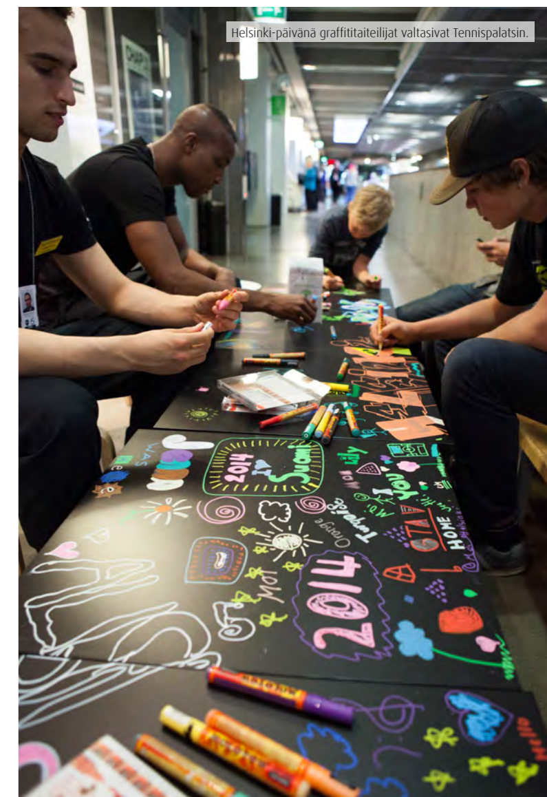
Helsinki-päivänä graffititaiteilijat valtasivat Tennispalatsin.

Monikulttuurisuutta ja monikielisyyttä edistäviä, vuonna 2009 käynnistettyjä Babel-työpajoja jatkettiin. Babel-pajoja vetivät Suomeen eri maista muuttaneet taiteilijat ja taidekäsityölläiset omalla kielellään.