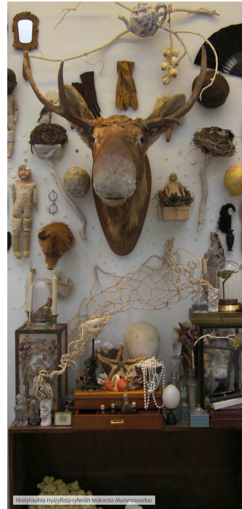
Yksityiskohta Hyäryllistä-ryhmän teoksesta Mummovuuduu .