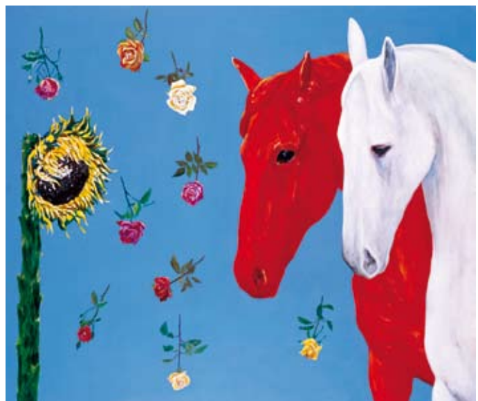
Punainen ja valkoinen, 2005 © Risto Suomi, kuva: Museokuva