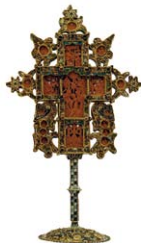
Stinausristi, 1707, © Ivironin luostari, Athos

Yhdeksästä Athosvuoren luostarista ja 15 eurooppalaisesta museosta koottu n. 600 näyttelyesineen kokonaisuus sisälsi satoja vuosia vanhoja ikoniaarteita, käsikirjoitusharvinaisuuksia, ainutlaatuisia sakraaliesineitä, upeita tekstiilejä, puukaiverruksia sekä muita taide-esineitä, kuten koruja, ristejä, karttoja, valokuvia ja maalauksia. Näyttely oli erityisen kiinnostava suomalaisille, vaikka vain reilu prosentti kansasta on ortodokseja. Näyttelyn yhteydessä julkaistiin Athosvuoren elämää ja taidearteita esittelevä laaja näyttelykirja.