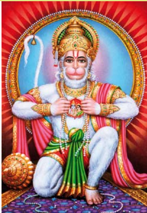
Hanuman-jumala, tuntematon taiteilija, painokuva.

India Express -näyttely oli sukellus miljardin asukkaan myyttiseen Intiaan. Näyttelyssä tutkittiin Intian taiteen mytologisia piirteitä pyhän ja populaarin yhdistymistä. Näyttelyssä oli esillä populaareja painokuvia, palvottuja alttariveistoksia, suosittuja sarjakuvia, uusia ja vanhoja käärimaalauksia, painettuja ja käsinmaalattuja Bollywood-julisteita, nykytaidetta, valokuvia ja dokumenttifilmejä. Näyttely oli esillä molemmissa kerroksissa.