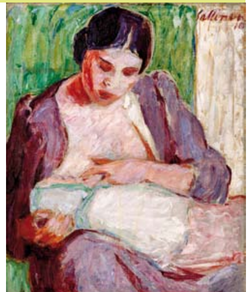
Tyko Sallinen: Äiti ja lapsi 1976

Kamarimusiikkia Bäcksbackan näyttelyssä 5.2. ja 5.3.