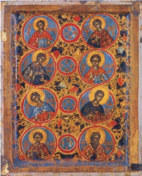
Pyhät Makkabealaiset

Näyttelyn oli kokonaisuudessaan koontanut Helsingin kaupungin taidemuseo ja sen kuratoi taidemuseon johtaja Berndt Arell. Näyttelykoordinaattorina toimi amanuenssi Mikko Oranen. Näyttelyarkkitehtuurin suunnitteli lavastaja Ralf Forsström.