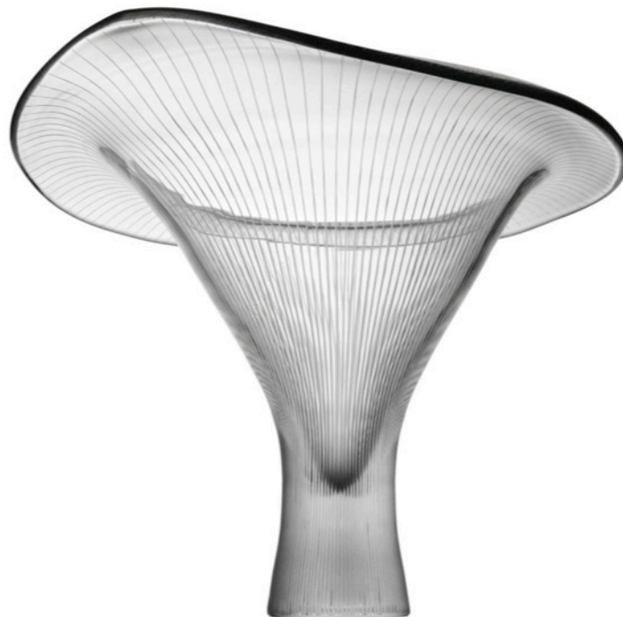
Tapio Wirkkala: Iittala-Kantarelli, 1946.