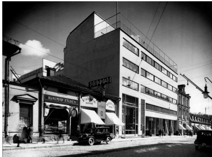
Turun Sanomien painotalo (Alvar Aalto 1928–29)

© Arkkitehtuurimuseo. Kuva: Aarne Pietinen 1942.