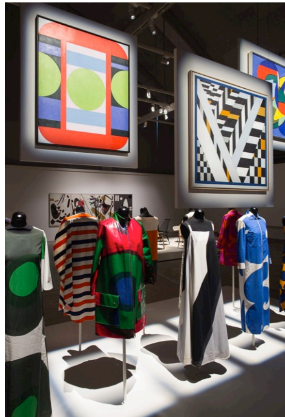
Modernia elämää! (näyttelynäkömä)