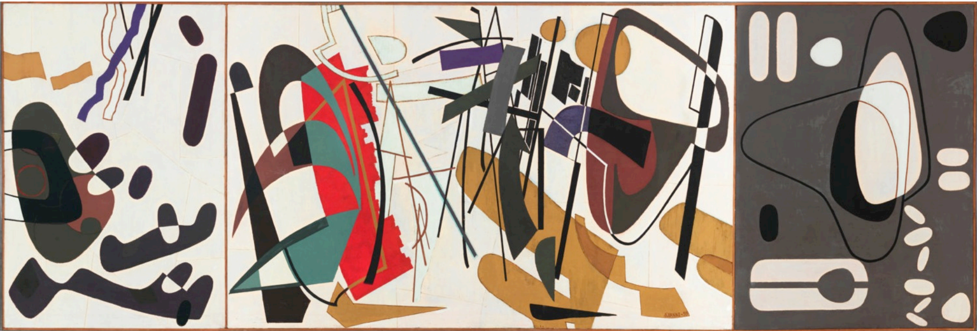
Sam Vanni: Contrapunctus, 1959.