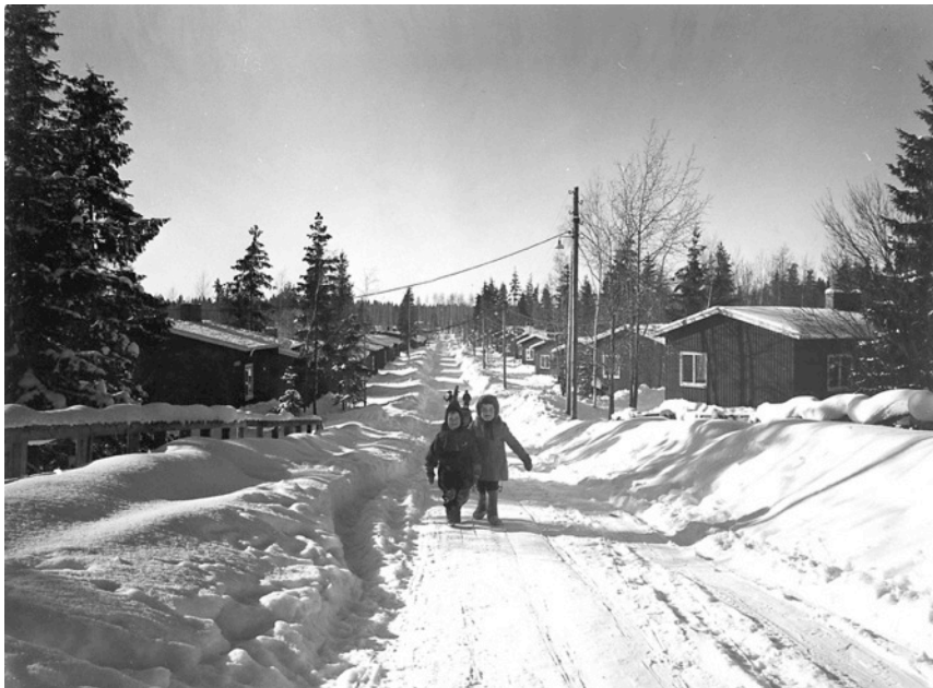
Ruotsin lahjataloalue (1940–41), Petaksentie, Pirkkola, Helsinki.