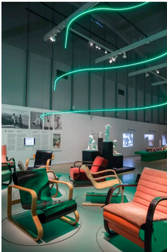
Modernia elämää! (näyttelynäkömä)